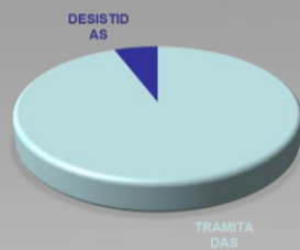
TRAMITACIONES RSH 2017